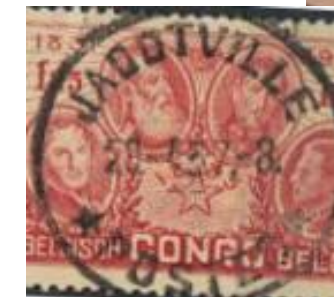
En 1931, en guise de reconnaissance pour son soutien à l'essor de la colonie en général et du Katanga minier en particulier, l'agglomération de Likasi-Panda, un des deux principaux centres industriels du Congo, fut rebaptisée Jadotville.