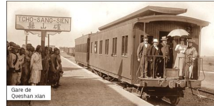
Gare de Queshan xian