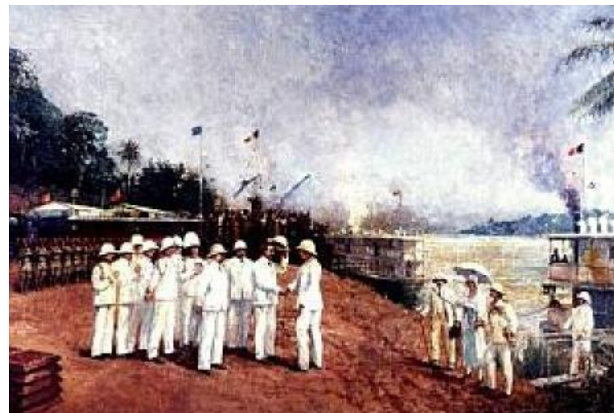
Jean Jadot est nommé directeur de la Société Générale de Belgique. Il participe à la mise en œuvre du chemin de fer reliant le Katanga au Bas-Congo. (Jean Jadot accueille le roi Albert I au Congo.