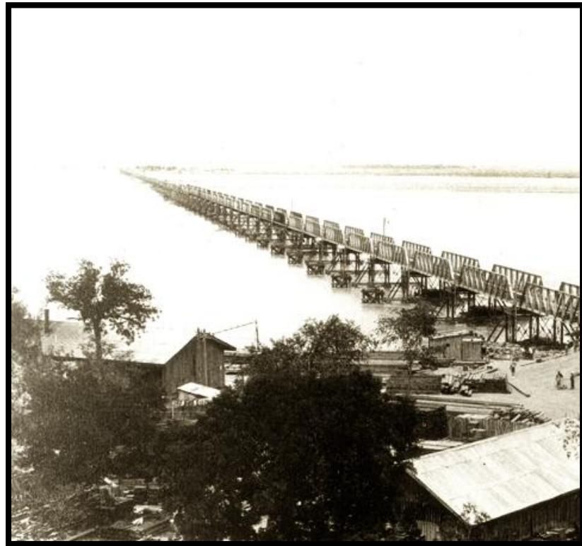
Réalisation de la ligne de train de Pékin à Hankou, plus de 1200 km. Construction d'un pont de plus de 3 km sur le Fleuve Jaune