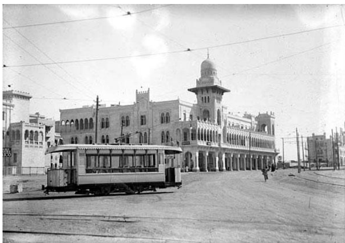
Avant son implication en Chine, Jean Jadot était associé à Edouard Empain dans la construction du tramway du Caire.