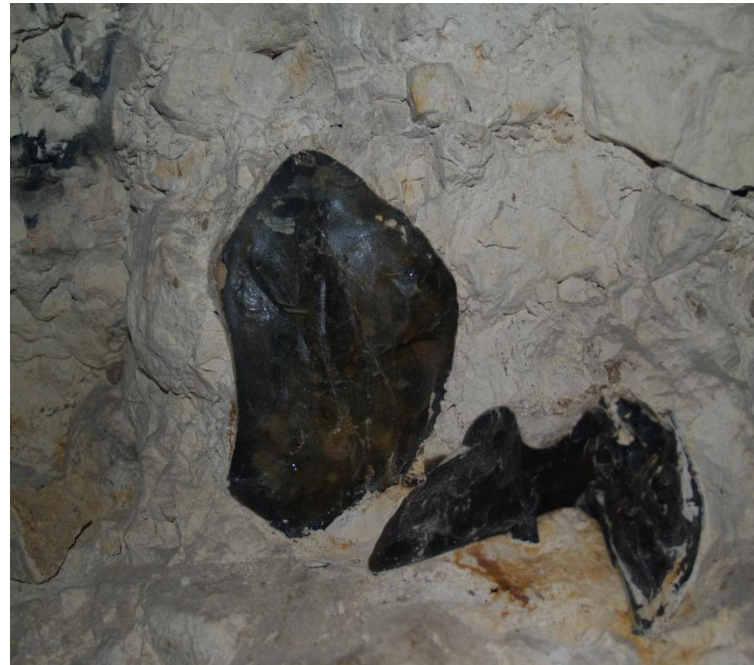
Inclusions de silex dans la craie de Spiennes