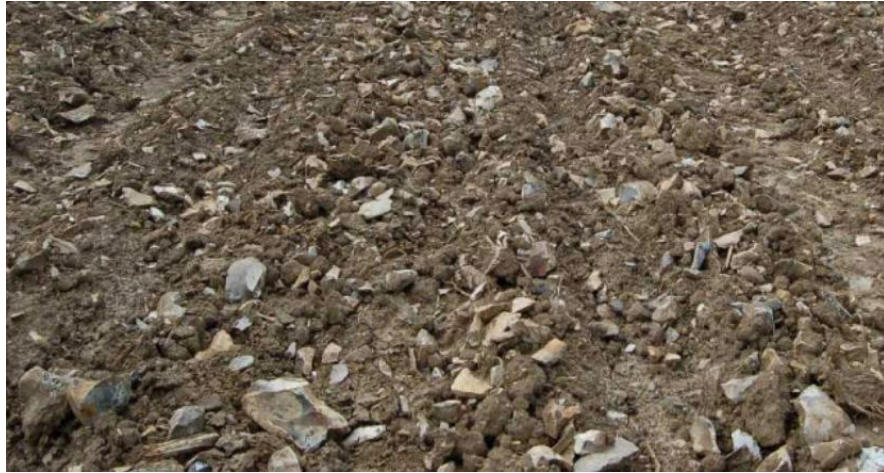
Image du "Camps à Cayaux", champs de déchets de la découpe des silex.

Les minières de Spiennes furent exploitées durant le Néolithique, de 4 300 ans av. J.-C. à 2 200 ans av. J.-C. Des silex de Spiennes ont été retrouvés jusqu'à 150 km du site.