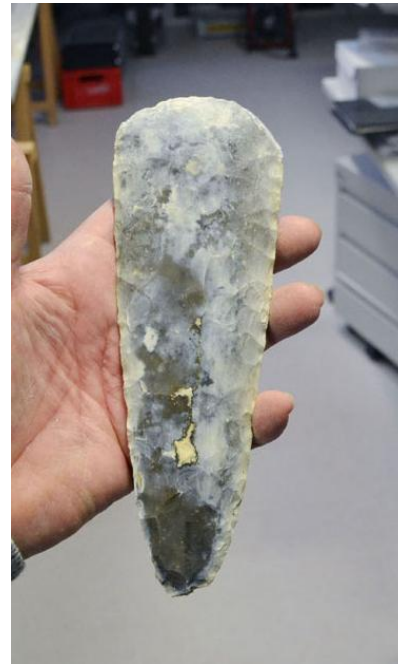
Hache en silex de Spiennes