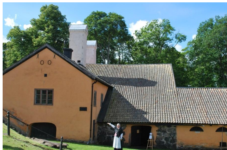
«Vallonbruk», un village articulé autour de la forge, construit par les Wallons lors de leur arrivée en Suède, au début du XVII e siècle.