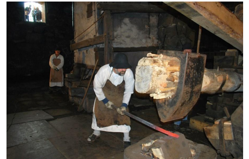
Reconstitution d'une opération de forgeage dans le village Vallonbruk, le "maka" est remis à la tâche.