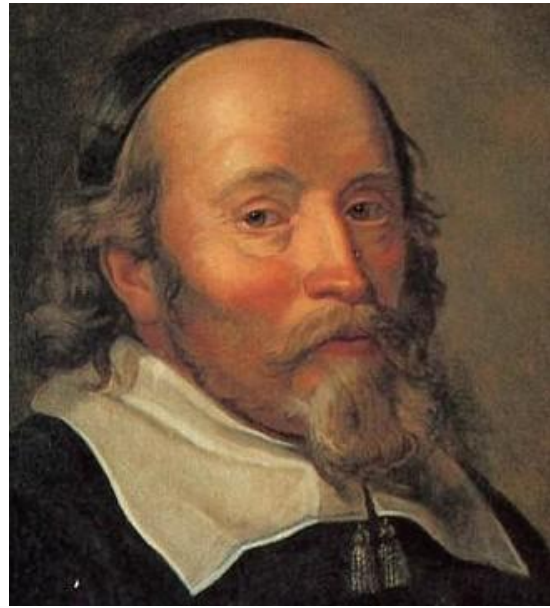
Guillaume de Bèche est appelé en Suède en 1595 par le duc Charles, futur Charles X. Il s'établit à Nyköping où il prend à ferme les mines de cuivre, ainsi que les fourneaux et les forges qui y étaient attachées.