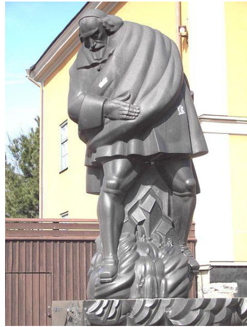
Louis De Geer recrute en Wallonie, et ce dans les règles, avec bureau de recrutement et contrats de travail soigneusement rédigés. Entre 1620 et 1640, ils seront cinq mille environ à répondre à l'appel