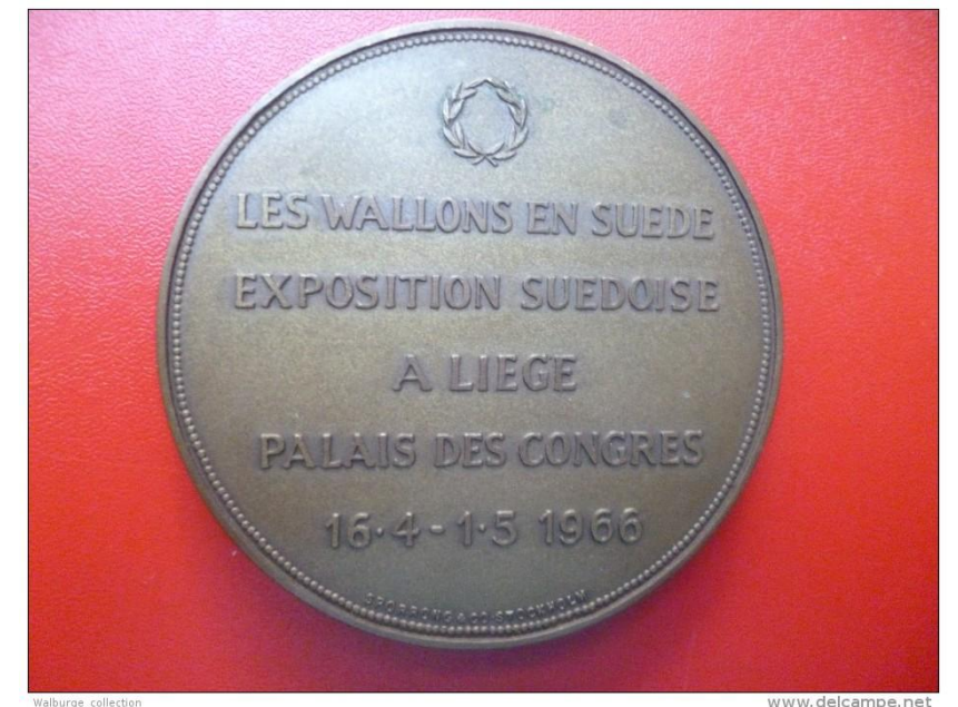
Médaille commémorative de l'exposition de Liège en 1966 consacrée aux Suédois.